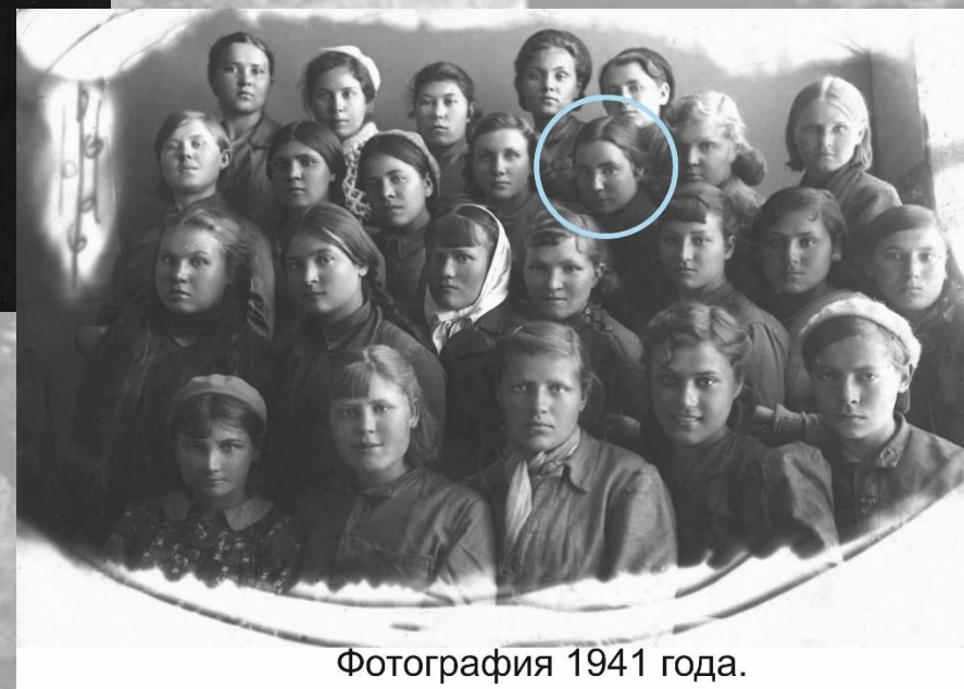
Фотография 1941 года.